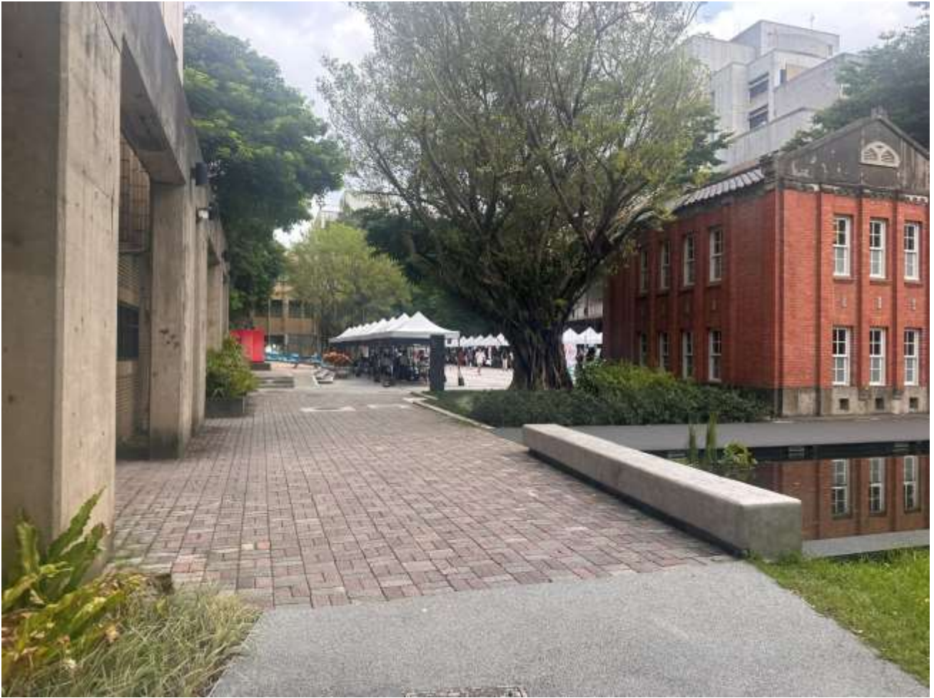
Ein Bild vom NTUT Campus. Dies war der erste Vorlesungstag und die Clubs der Uni haben sich auf dem Campus präsentiert, um neue Mitglieder anzuwerben.