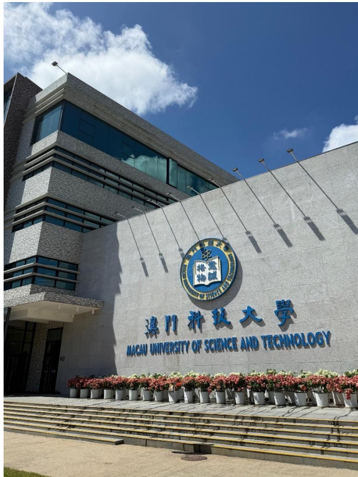
Block N Library Building