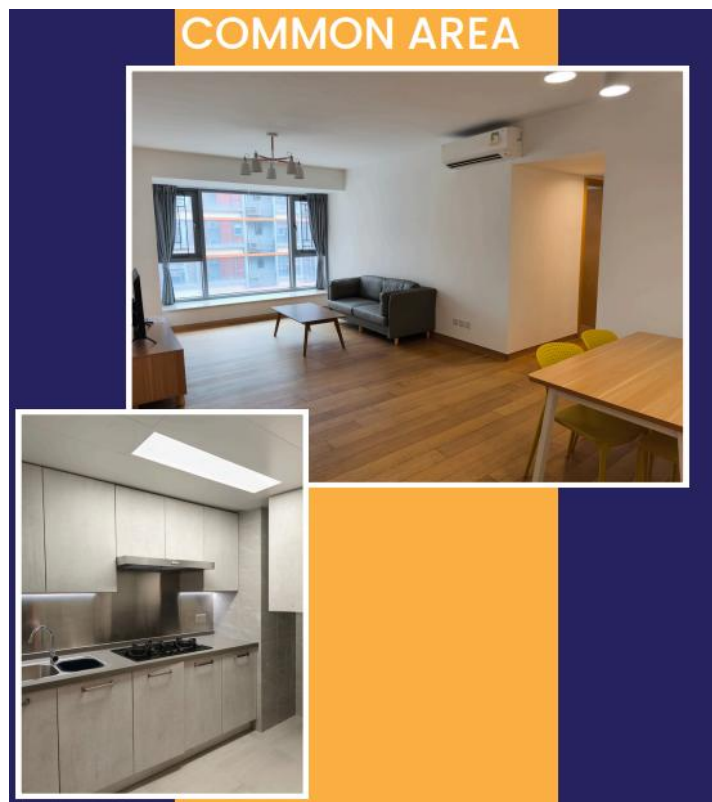
Wohnbereich unserer Wohnung