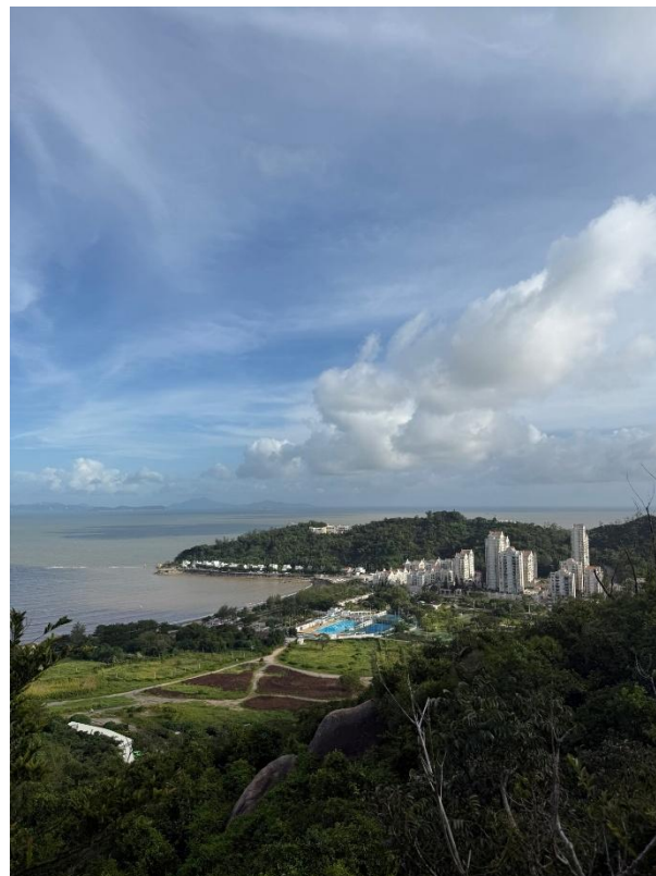
Das Leben in Macau